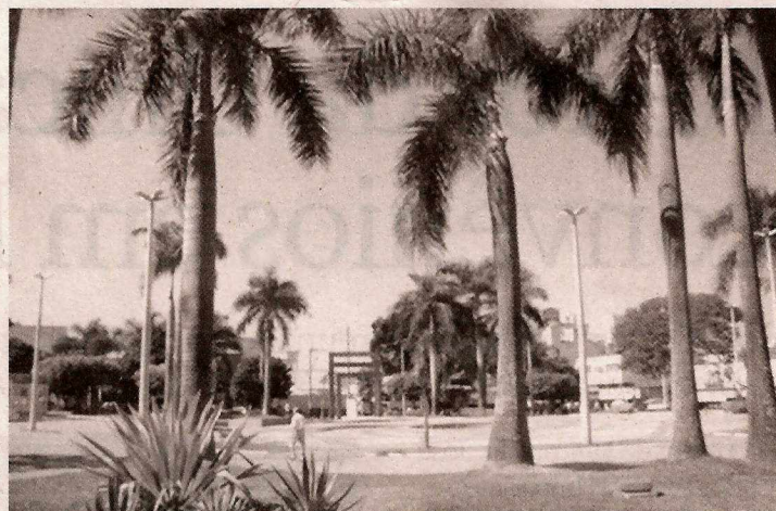
Praça Joaquim Antonio Pereira, onde acontecerão os testes

SERVIÇO: TESTES SOROLÓGICOS DATA: Sábado (11/06) LOCAL: Praça Joaquim Antônio Pereira HORÁRIO: 8h as 12h REALIZAÇÃO: Prefeitura de Fernandópolis/Cadip